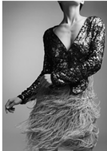
SINGLE BREASTED LINEN DECONSTRUCTED