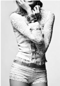
COTTON LINEN SHIRT SPRING 2013